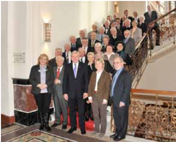
Die Teilnehmer des Neujahrsgesprächs beim hessischen Ministerpräsident Volker Bouffier