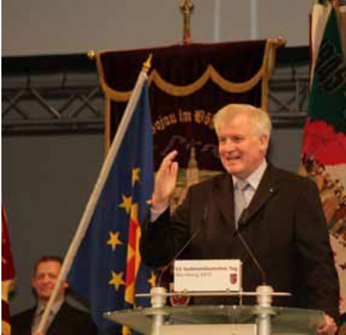
Horst Seehofer

Der Bayerische Ministerpräsident Horst Seehofer hat beim 63. Sudetendeutschen Tag in Nürnberg die Sudetendeutschen als vorbildliche Brückenbauer Europas und Pioniere für Bayerns Wohlstand gewürdigt.