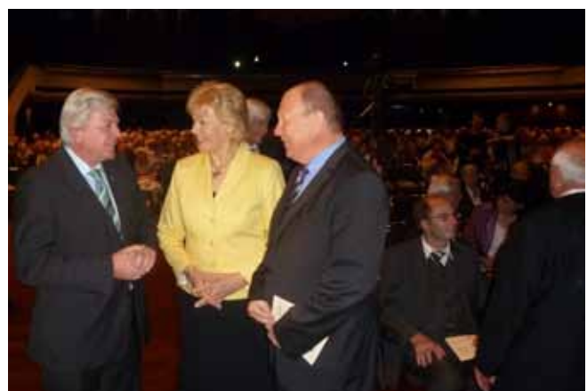
v.l.: Volker Bouffier, Erika Steinbach, Klaus Brähmig

wahrgenommen werde, „weil es gelungen ist, unsere Kräfte zu bündeln. Bei uns steht die Zusammenarbeit nicht nur auf dem Papier, sondern sie wird praktiziert.“ Der Verband arbeite